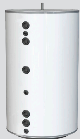
WT-V 750 FC DN80

WT-V 750 FC -puskurisäiliö on saatavilla 3 ja 6 baarin versioina, mahdollistaen käytön myös korkeissa rakennuksissa, joissa kuumavesijärjestelmä vaatii korkeaa käyttöpainetta. Kummatkin versiot ovat lisäksi saatavana neljällä DN80-liitännällä, kun virtauksen tarve on suuri.