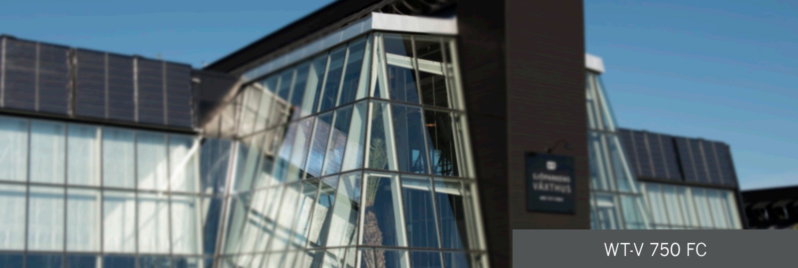
WT-V 750 FC