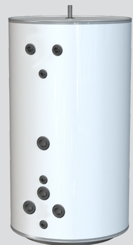
WT-V 1000 FC DN80

WT-V 1000 FC -puskurisäiliö on saatavilla 3 ja 6 baarin versioina, mahdollistaen käytön myös korkeissa rakennuksissa, joissa kuumavesijärjestelmä vaatii korkeaa käyttöpainetta. Kummatkin versiot ovat lisäksi saatavana neljällä DN80-liitännällä, kun virtauksen tarve on suuri.