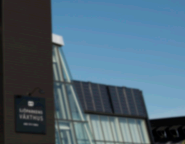
WT-V 1000 FC